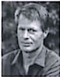
Jean-Marie Gustave Le Clézio

est né en 1940. Il est l'auteur de nombreux ouvrages dont on peut citer Le Déluge (1966), Pawana (1992), et Ouranina (2005). Il a commencé à écrire à l'âge de sept ans ; à 23 ans, il obtient le prix Renaudot pour son livre Le Procès Verbal puis en 1980, il est le premier à avoir le prix Paul Morand. Il obtient le prix Nobel de littérature en 2008.